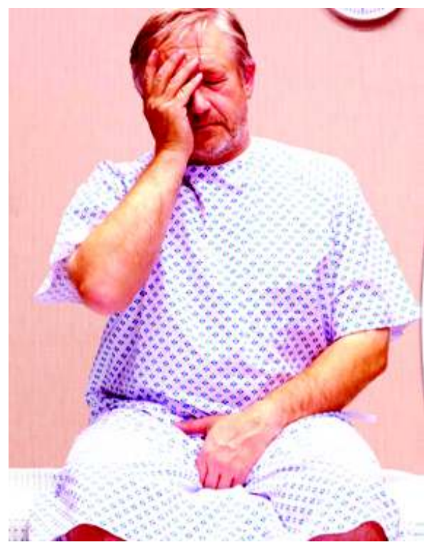
গ্ৰীন টিম অসুং চম্প্ৰা মহীগী কাৰবা মীপুম খুদিংমক্ক খঙনরে। অদুদু অনী অসি যানশিন্নরগা থকপনা অমুকা হোকা কলৈ হায়বা মীওই অয়ানুনা খঙনরে।

বোদি রেথ হেনগৎ-হন্দনবা হোংনগদবনি। মীৰোয়লিঙে মনুংদা হকচাংগী অরুয়া হেনগৎলকপগা লোয়ননা ব্ৰদ ষ্ঠাকোজ বাংখংলকবদি পুঙ্কুং দা লৈরিবা অঙাংগী মেটাৰোলিজমদা অকায়বা থোক্কহন্দুনা অনোয়বা অঙাং পোক্কপা যাই।