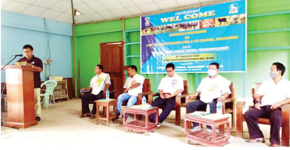
ভৌতিনিরনর এন্ড এনিমেল হজবেল্লি সৰ্ভিসেসনা শীলুনা মোরোদা ভ্রাসবাউদির এনিমেল ডিজিঙ্গ এফ এম দিগী মতাঙদা পাঙথোকখিবা এন্ড প্ৰোগ্রাম

হায়জরিবা : Leader : Leima New-2R Centre Thiyam Leishangkhang