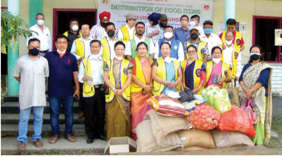
কংলাতোংবী চিলামেন হোমদা লাইওঙ্গ ক্ৰব ওফ ইম্ফালনা লাইওঙ্গ ক্ৰব ওফ ইম্ফাল নোর্থ ভেলিগা খুংশুন্নৰগা চানবা পোংলমশিং তেংবাং পীথিবা