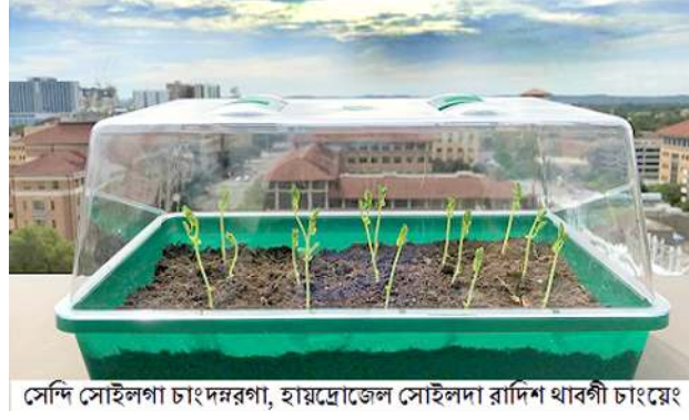
সেদি সোইলগা চাংদমরগা, হায়ব্রোজেল সোইলদা রাশি থাবগী চাংয়েং

মণিপূরগী ওইনা য়েংলগসু চেঙগুপ্তা পোথোক খরদা মতিক চাবা নন্তনা, হবাই-চেঙরাই, তিলহৌ-চনম, চানবা থাওগী পোথোক্কাচিংবা কয়াদি মতিক চানা পুথোকপা গুম্দি। মসিগী মরু ওইবা মরম অমদি চহী চুপ্পমা মইহে-মরোং থানবগীদমক ঙ্গিশিং ফংদবা অসিগী।