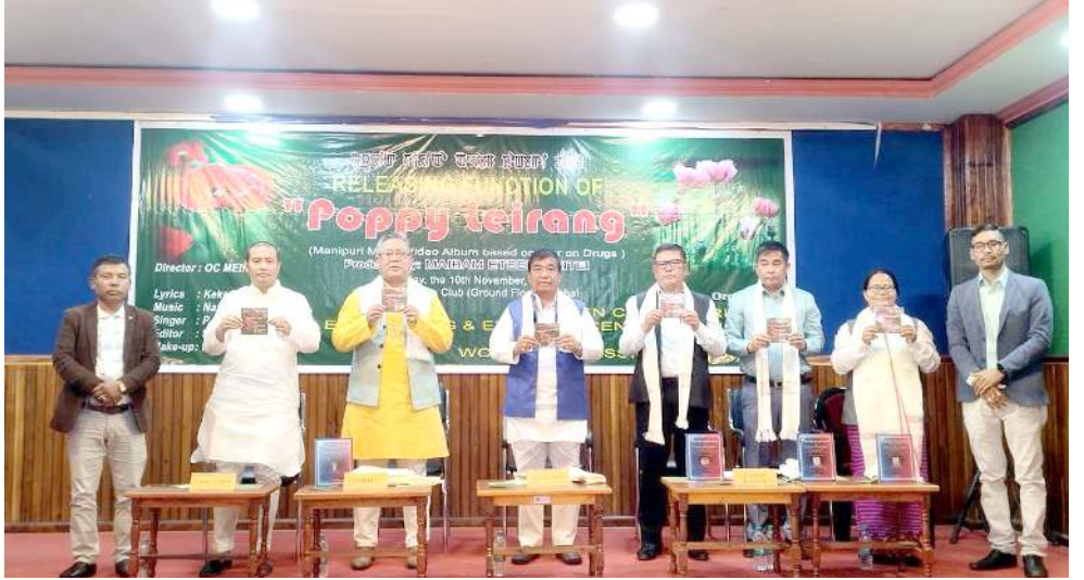
মণিপুর প্ৰেস ক্লবতা পাণ্ডথোকখিবা পোপি লৈৱাং হায়না মিংখোনবা বাৱ ওন দ্ৰৱসতা শৈখাৰা মুজিক ভিডিও এলবম অমা ফোণ্ডকী যৌৱমদা শৰুক য়াখিবশিং

এস পি অসিনা মখা তানা ফোণ্ডদোকখিবদা, হৌখিবা কুমজা ২০১৮ দগী হৌৱগা ইশান উদয় স্কোলারশিপ স্কিমগী মখাদা বোম্বাইগাউন দিষ্টিক্টতা লৈবা লঙলা কোলেজ, বরপেতা দিষ্টিক্টকী বনিয়ৱপাদা লৈবা পোপুলৰ কোলেজ, কোয়াকুসি কোলেজ, হৰেন্দ্ৰ-চিত্ৰ কোলেজ অমসুং অভয়াপুৰিদা লৈবা সী কোলেজদা থানৱকখিবা লুপা ফ্ৰোৱ কয়্যারোমগী ওইগদবা শেনফমশিং অৱানবা মওংদা মীওই খৱনা হৈনথোক্কা হায়না মখা তানা ফোণ্ডদোৱক্কা।