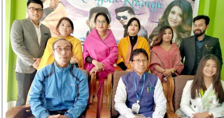
ইফাল, দিসেম্বর ১০ (এচএনএস): গোল্ড পিকরগী মখাদা নৌনা পুথোক্জিবনা 'নওসু খঙউ' হায়না মিৎথোনাবা মণিপূরী ফির ফিল্মগী হায়ফ থৌনি থৌরম পাঙথোক্জ্রে।

ইফাল, দিসেম্বর ১০ (এচএনএস): গোল্ড পিকরগী মখাদা নৌনা পুথোক্জিবনা 'নওসু খঙউ' হায়না মিৎথোনাবা মণিপূরী ফির ফিল্মগী হায়ফ থৌনি থৌরম পাঙথোক্জ্রে। ওসি পাঙথোকখিবা থৌরম অদু শঙউইপ্রৌ মমাং লৈকায়দা লৈবা ফিল্ম অসিগী প্রদুসরগী যুন্দা পাঙথোকখিবনি হায়রি।