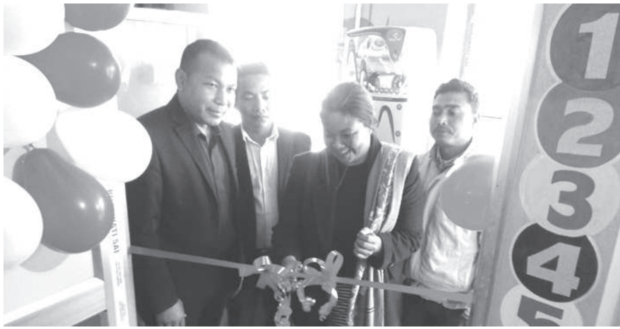
নু দেল্লিদা লৈবা মায় হোতা স্কুলগী মখাদা যাইরিপোক বামোন লৈকাইদা কিদস মোল্ড স্কুলগী কেথেল মশা অমা হাঙদোকখিবগী শত্ৰম

ট্রাফেক্স/খোঙ হান্না যাদবা, খোঙ হান্নগস মতুংদা হান্নবা মতম কুইনা খজিঙং হান্না, অমাংখোং ময়াদা মচা মচা পোমথোক্কা লৈবা, অমাংখোংগী অকোয়বদা মরেং চংলগা হাক্কা, খোঙ হান্না লোয়রবা মতুংদা যান্না শাবা ফহনবগী স্টেট অমদি নেসনল এৱাৰ্দ ফলবা ওজা জিয়া উল হকপু থাগচরি