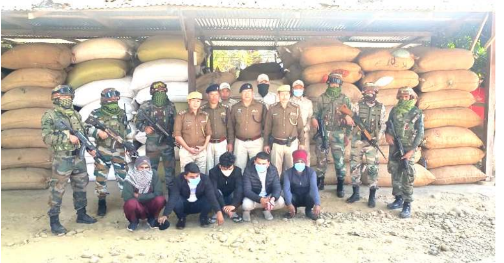
লৈঙাপোকপী পুলিস আউট পোষ্টত জিৱি পুলিসনা চখাখিবা লম্বীগী থি হুংগী থবজা ইল্লিগেল ওইবা মওংদা সুপাৰি পূৰ্বৰূদগীদমক ফাৱবা মীওইশিং

চেৱেল অসিনা মথা তানা ফোঙদোকথিবদা, হোখিবা কুমজা ২০২১ গী জুলাই ২৪ দা লৈবাক অসিগী প্ৰাইম মিনিষ্টৱ নৱেন্দ্ৰ মোদিদা নাগা বোদিশিংনা নাগা পোলিটিকেল ইস্যুগী ৰাৱোইশিন অথবা মতমদা লোয়শিলবা হায়জবা লৈত্ৰে। সেণ্টৱদা মায়কৈদগী হিৰম অসিগী মতাংদা য়েংশিল্লি হায়না মতম অদুনা পাউখুম পীৰকপ্ৰবসু ওসি ফাওবা থবক ওইনা পায়খংপা লৈত্ৰি। অমৰোমদা গভৰ্ণমেণ্ট ওফ ইণ্ডিয়া অমসুং তোঙান তোঙানবা নাগা পোলিটিকেল গ্ৰুপশিংগা হৌজিক চখৰিবা পীছ টোক অসিদা ইষ্টৱনাগা পিপলস ওগনাইজেশ্যনগী মথাদা লৈবা ট্ৰাইব ওয়াণনা নাগা ট্ৰাইবেলিংনা মপুঙ ফনা শৌগাংপা হায়নসু ৰাৱেপ লৌখিবা লৈৱে হায়রি।