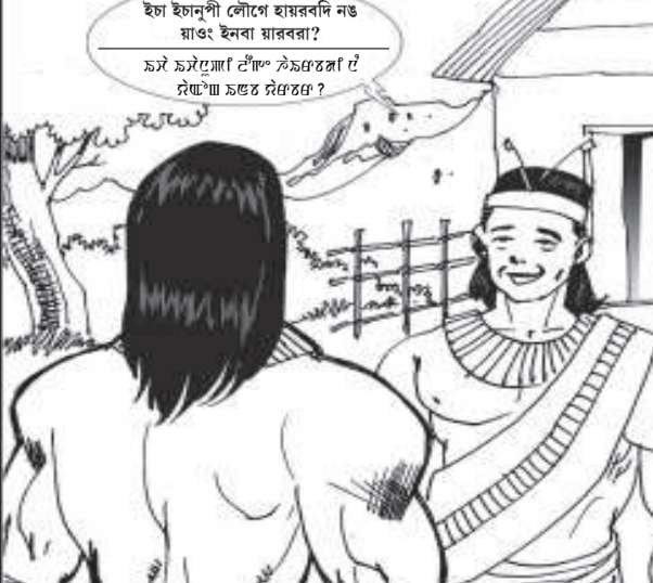
ইচা ইচানুপী লৌগে হায়ৱবদি নঙ য়াঙং ইনবা য়াৱববা? চমই চমইগো টোপ্পা লৈজবতলা টে টুংখা জবত বিজতলা ?