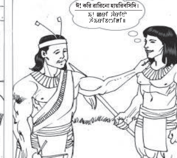
ঈ! কৰি ৱাৱিনো হায়ৱবদি। চ! ঈগে টেগেট ঈজগেটগে।