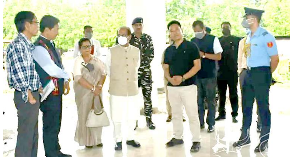
অসাম অমসুং নাগালেণ্ডগী গভর্নর প্রোফেসর জগদিস মুখিয়া দিমাপুরদা হৌজিক হৌজিক শারিবা বিজনেল কনভেন্সন সেন্টরগী ফিডম য়েংশিনখিবা

হিরম অসিগা মরী লৈননা মহাক্সা ফোডোকখিৱদা, পাটিগী ওইবা থৌরম অমগা মরী লৈননা ঙাক শেনবগী থবক তৌখিবা সিক্যুরিটি ফোশিং অমদি জনেলিষ্টিংগী মরতাং অৱাই অখুম তৌনখিবা অদু লাইৱিক খিৱনি। সিক্যুরিটি ফোশিংগী ওইনসু মথোয়গী তৌফম থোকপা মথৌ অদু তৌৱনি অদুগা জ মেলিষ্টিংগী ওইনসু উপ চাবা মথৌ তৌখি। অদুবু পাউ ফাউনহৌদবদগী থৌদোক অদু থোকখিৱনি হায়রি।