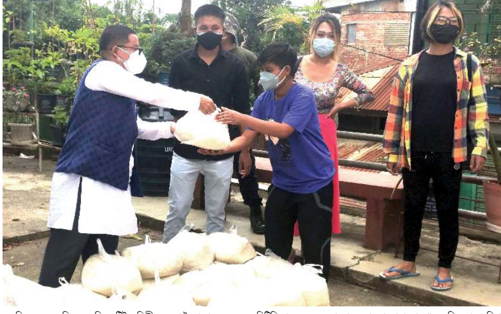
ককচিং অমসুং ককচিং এসেমব্লি কৰ্মাট্টিয়েলিগী মনুং চ্চা লৈবা ব্ৰাণ্ডজেন্দৰ কন্মুনীচিংশিংদা এম এল এ ময়ংলাংবম বামেশ্বৰনা চানবা পোংলমশিং তেংবাংখিবা

নান্থা মখা তানা ফোঙদোকখিবদা ফুল ওখোরিচিংশিংসু য়াৰিবমথৈ পেদ দামিক মনুংদা মইহেৰোয়শিংগীদমতা পায়খংপা য়াৰা থবক খৌরমশিং পায়খংনবা হোংনগদবনি। অমদি লৈঙাকী মায়কৈদগী তৌহমিৰা থবকশিং লৈরবসু ফুল ওখোরিচিংশিং চিংনবা লৈতনা ফোঙদোকখিবদনি।