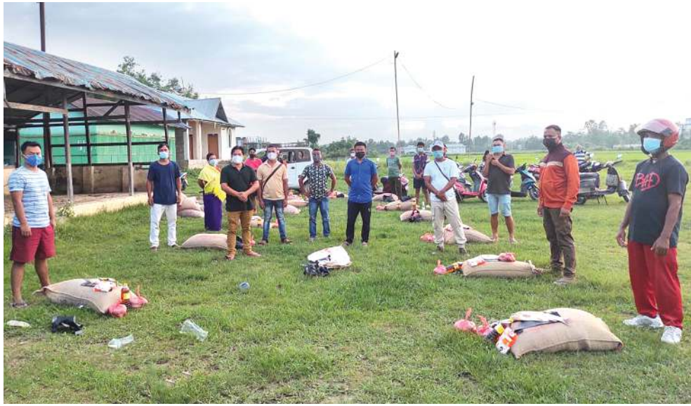
কোভিড-১৯ কলকোৱা তৌদনা ব্ৰুণ্টলাইন ৱায়িৱায়িগি ওইনা মথৌ তৌদনা কোভিড পোজিটিভ ওইৱাৰা হৌবাৰ দিষ্ট্ৰিক্টকী ডি ডি এফ পাৰ্সনেল ২০দা দিষ্ট্ৰিক্ট অসিগী এস পি জোগোসচ্চ হাওবিজম (আই পি এস) গী লমজিং মখাদা চান-থৰুৱা পোংলমশিং য়েছোকথিবা

মীংকুপ নাহম শিংনা মথৌ তৌদনা লাকবিবনি। ৱাইল্ডলাইফ ডিভিজনগী পুলিসনা ফাৰিবনি। কুমাৰ ২০২০দা কাৰ্জিৱা নেসনল পাৰ্কতা শামু গন্দা হাংপা অমদি মচী লল্লোনবদা থবকা মচী লৈননা মচাৰুপ ফাৰিবনি। মহাৱ্ম হায়দাৰকপদনী মীওই ২ অদুসু গুনি ফাৰা গুনিবনি।