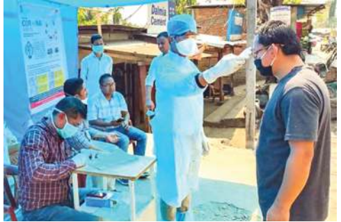
ৱিকোভৰি ৱেট অসি চাদা ৯৭.১৮ ওইৱি। হৌথিবা লৈবাকপোকপা নুমিংতা ষ্টেট অসিদা কোভিড-১৯গী অনৌবা কেস ৯২৯ থেংনবিগা লোয়ননা লাইচং অসিনা মীওই ১৬ শিখনবি।

গুৱাহাটী, গুৱা ১০ (এজেন্সী): অসামদা হৌথিবা পুং ২৪গী মনুংদা কোভিড-১৯গী অনৌবা কেস ৮৮৬ থেংনবিগা লোয়ননা হায়ৱিবা মতম অসিদা লায়না লাইচং অসিনা মরম ওইৱগা মীওই ১৪ শিখনবি হায়না ষ্টেট হেল্প দিপাৰ্টমেণ্টকী মায়েকদী ফোঙদোৱকি।