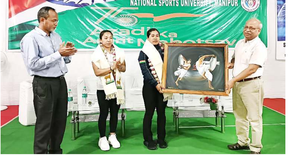
হন্দক পাণ্ডথোকখিবা কয়ন ৰেণ্ট গেমসতা ৰেথ লিফটিং মশাৱা গোল্ড মেডেল লৌৱক্সী সাইখোম মিৱাই অমদি সিলভৰ লৌৱক্সী এস ৰিশিৱানিৰু তৱান্না ওকখিবা

প্ৰদেশকী চীফ মিনিষ্টৰ পেমা খাং দুনা ফোণ্ডদোকখিবদা, স্টেট অনীগী মৱতা মতম শাংনা চয়েংনদুনা লাক্সিবা ঙমখৈগী ৰাথোকশিং লোয়শিনবগীদমক নাকল অনীনা মমাং থাদা খুংয়েক পীনখিবা অদু য়ান্না মকুওইবা মতাং অমনি। নাকল অনীনা অমতা ওইনা হোংনমিৱদুনা ওসিদি চয়েংনবা কয়া লৈৱিবা অদু লোইশিনবগী য়াৱগী ফিভমলা লাক্লে। মীয়াৱল্লু সৈৱাক্সা পায়খংলক্সিবা অমদি লৌৱকপা ফিৱেপশিংদা হোৱা মতুং পাংশিন্দুনা হান্না লৈৱনৱা নুংশিনবগী মৰী অদু থুগায়দুনা ঙমখৈগী শৰুৰুগী চাৱনা লৈমনিৱা হোংনমিৱসি। জোইন্ট টিম অদুগী ৰিপোৰ্ট লাক্সা মতুং ৰাৱেইশিন অমা শোয়দনা পুৰুষগনি হায়বগী থাজবা চপ চানা লৈ হায়ৱি।