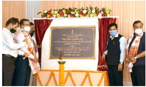
গুৱাহাতিদা ইন্ডেক্সটেক্স শেমগং-শাগংপগী থবক ষোঙজেল থনা পায়খংলিবসি স্টেট গভৰ্নমেণ্টকী সিটি অসিবু সাউথ-ইষ্ট এচিয়া অসুপুৰী গেটেৰে ওইহনবগী পান্দমগী শৰুক অমনি হায়না ফেঙদোকপগা লোয়ননা চীফ মিনিষ্টাৰ হায়খি মদুদি অসামবু লেবাক অসিগী ষাইদকী ফবা স্টেটশিংগী মনুদা অমা ওইহনবগীদমজা

গুৱাহাতি, ওক্টোবৰ ১১ (এজেন্সী): অসামগী চীফ মিনিষ্টাৰ সৰ্বনন্দ সোনোৱালনা গুৱাহাতিগী মালিগাউনদা কমফা গেট অমদি পাৰ দুগা শমুহনগদবা অনৌবা ফ্লাইওভাৰ অমা শান্নবগীদমজা নোংমাইজিং নুমিতা উৱেপ-উয়ুং তমখ্ৰে।