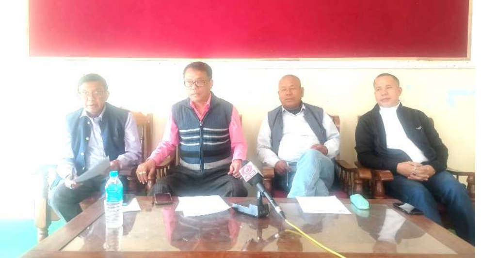
প্ৰি বোৰ্দ এগজামগী মতুংদা ওল মণিপুর ৱিকগনাইজ প্ৰাইভেট স্কুল ৰেলফোৰ এসোসিয়েশ্যননা পাণ্ডথোকখিবা পাউগী মীফমদা শৰুক য়াখিৰাশিং

অসিগী মতুংদা ফখিবা ৰিপোর্টশিং শেমদোক শাদোকপগী মৱালদা মহাকপু ফাখিৰনি। মদুগী মতুং থা অসিগী ৮ দা সশ্বেদন্দনা লৈৱিৰা দরং দিষ্টিক্টকী এডিষ্টেল এস পি ৰূপম ফুকানসু সী আই দিনা ফাজিনখিৰনি। কেস অদুৰু মিসফেল জৌখি হায়বগী মৱালদা মহাকপু ফাখিৰনি। এডিষ্টেল এস পি অসি ফাখিবা নুমিত্তা অতোপ্লা দেক্টর অহমসু সী আই দিনা ফাখি। দেক্টরশিং অসিনা নুপীমচা অদুগী পেণ্ট মোটোমগী ৰিপোর্ট অদু শাশিৰা অৱানবা ৰিপোর্ট ওইনা পীথংলকখি হায়বগী মৱালদা ফাখিৰনি। থা অসিগী অঙনবদা কেস অসিগী আই ও ওইখিবা সব ইন্সপেক্টর উতপল বোৱাসু সী আই দিনা মীশি অসিগা মৰী লৈননা ফাখিৰনি। আই ও অসিনা একজ ওইৱিৰা মীওই অদুগী লুপা লাক্ষ ও লৈৱমখিৰনি হায়রি।