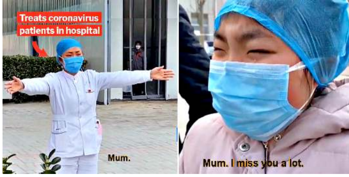
Mum. Mum. I miss you a lot.

করম্বা মমা-মপা ওইবগী থম্মোয়ানা খাঙবা ওমগদৌরিবনো মচাবু উনা-উনা মমাওমজুনা লেপ্ৰবফাওবদা শোকচবা, কোঞ্জবফাও ওমজব্দবদা... ফীভম অসি হৌজিক হৌজিক চাইনাগী প্রোভিস অমা ওইরিবা হুঁই অমদি অতৈ কোরোনাভাইরস লাইচৎনা শোকহল্লাবা মফম কয়াদা থোল্লিবনি।