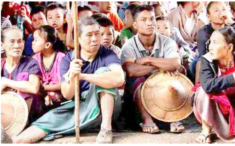
লৈঙাক্তা তুৰ্শিন্নবা বাফমশিং থমত্রে।