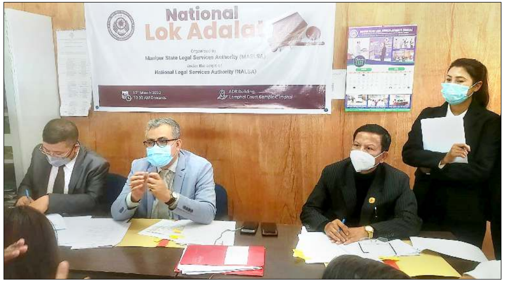
মণিপুর ষ্টেট লিগেল সৰ্ভিসেস ওথোরিটীনা শীদুনা লম্ফেলপাংতা লৈবা এ ডি আৰ সেন্টরদা নেসনাল লোক অদালট পাঙথোকখিবা

নীংশিংবা যাবদি, চীফ মিনিষ্টর জোরামথাংগুনা হুদুকা ষ্টেট লেজি সলচরদা ফোঙদোকখিবা, ষ্টেট অসিগী তোঙান-তোঙানবা মফমশিংদা ফেব্রুৱাৰী ১২ ফাওবদা ম্যান্মার মচা ২৪,২৮৯ লৈরি হায়খিবা।