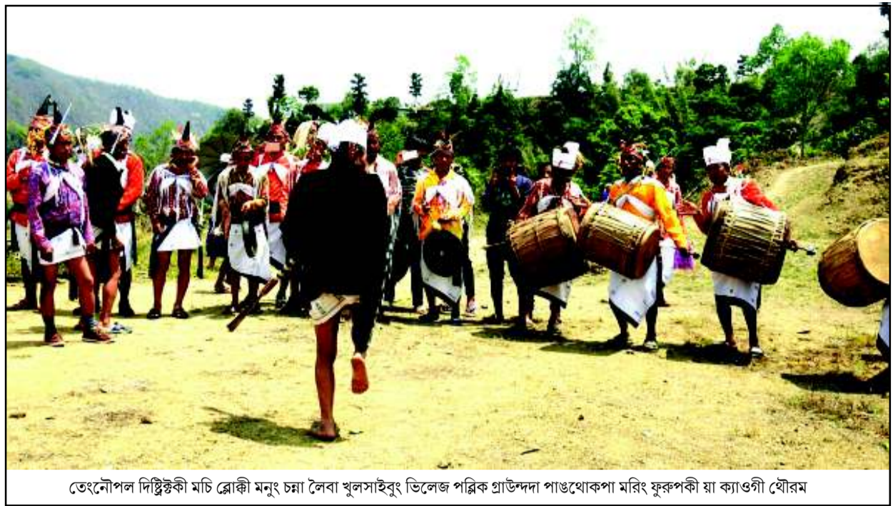
তেংনৌপল দিষ্টিক্কী মচি ব্লোকী মনুং চ্চা লৈবা খুলাসাইবুং ভিলেজ পল্লিক প্রাউন্দদা পাঙথোকপা মরিং ফুকপকী য়া ক্যাওগী যৌরম

টুৱাংচৰা/অমাংথোংগী অকোয়বদা মচৎ-মচৎ হেন্দোব্লগা পোমথোরকপা, অমাংথোং মনুংদা চিকপা নাবা তৌরগা খাঙবা ওমদবা অমদি ফুৰি মকুপ-মকুপ শৌরগা নাই চারকপা, অমাংথোং অকোয়বদা শাগংপা, খোঙ অকনবা হায়া মতমদা শাগংপা অদুনা মপান্দা দি থোকপা ফহনবগী ওজা জিয়া উল হগ-পু থাগৎচরি