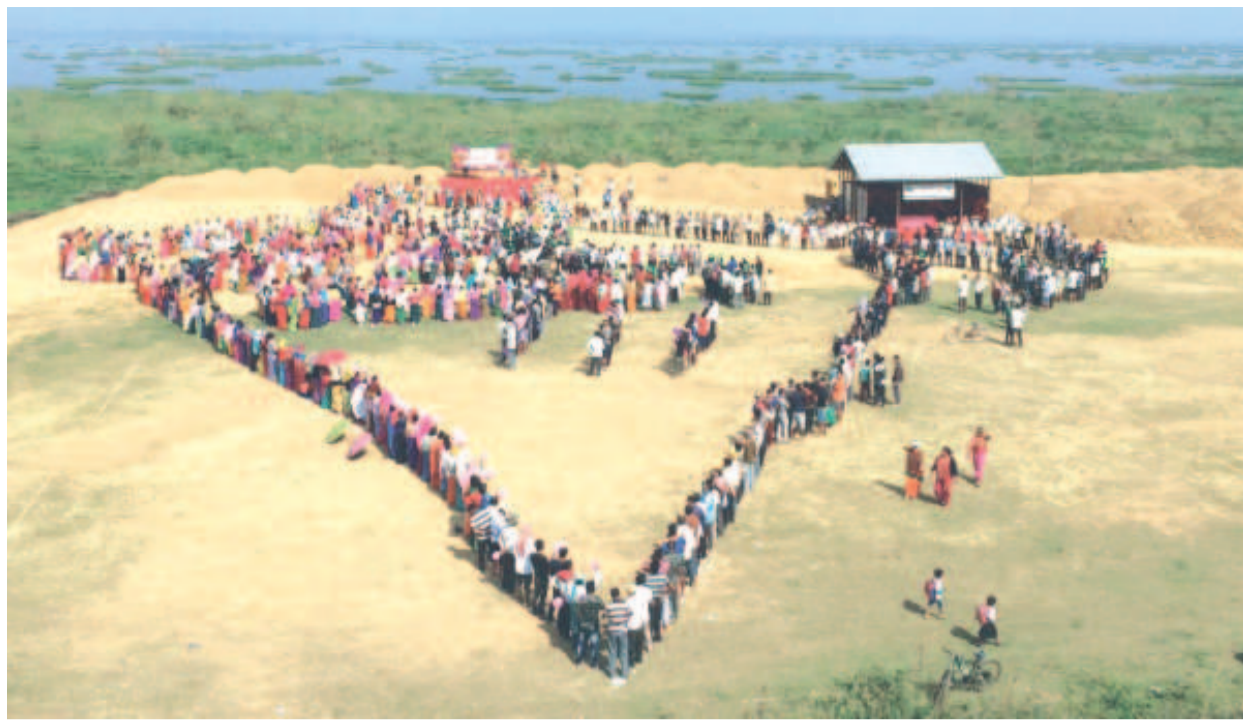
দি ঙ ঙ বিষ্ণুপুৰ, এন রাই কেনা শীন্দুনা থাঙ্গা পৱিত্ৰ গ্ৰাণ্ডবন্দা পাঙথোকপা এস ভি ঙি পিগী থৌৱমদা মীয়ান্না ইন্দিয়াগী মেপ মওংদা হামেন চেন শেঙ্গা