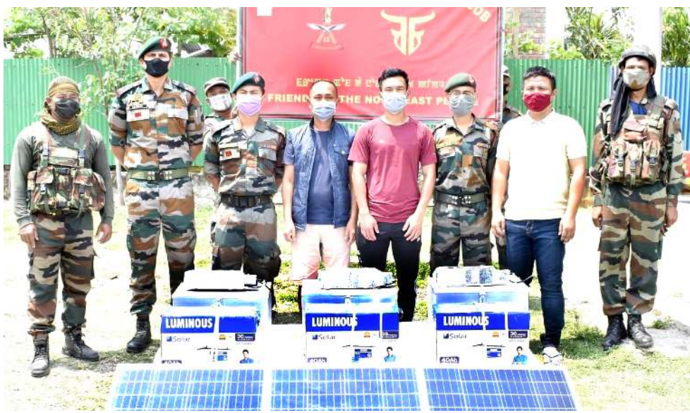
আই জি এ আর (সাজু) কী মীংয়েং মখানা ৯ সেক্টর অসাম রাইফলসকী মন্ত্রিপুত্রি বাটালিয়ননা ইস্থাল বেষ্টকী মনুং চ্চা লেবা ভাইফ ভিলেজতা অসাম রাইফলস সিডিক এঞ্জিন প্রোগ্রামগী মনুং চ্চা সোলার স্ট্রিট লাইট অহম মীয়ামদা খুংশিমাখিবা

অগরতলা, এপ্রিল ১২ (এজেন্সী): পোলিটিকেলগী ওইবা যানদবা রাফশিংগা মরী লৈননা বেষ্ট ত্রিপুরা দিষ্টিক্কী জরুলবচাইদা টি আই পি আর এ মোথাগী সপোর্টার অমা নোংমাইজিং নুমিত্তা হাৎশ্রে।