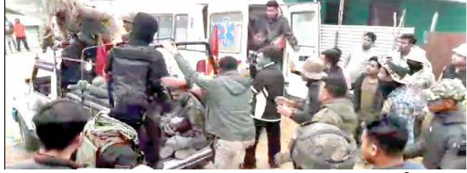
খুং থোকুংদা শোকুং খুল ঙাকপা অমা লায়েনবা এল্লুসেতা পুনবা হোংনখিবা

পল্লেল আইমোল লহীদা লৈবা মীতে ১গী উগী মিল কুকি মিলিটেটশিংনা মৈনা তুয়া থাদোকুং, চেম্বা মীওই ৬, নোংমৈ অমদি গাড়ী ৪ য়াওনা অতৈ পোৎলম কয়গা কোন্ননা ফারে