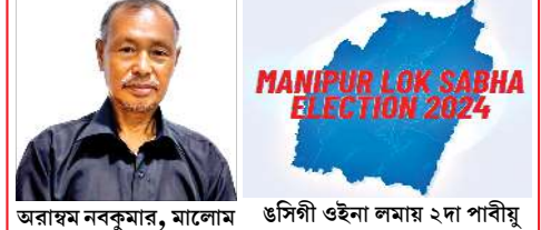
অরাধম নবকুমার, মালোম ওসিগী ওইনা লমায় ২দা পাবীযু