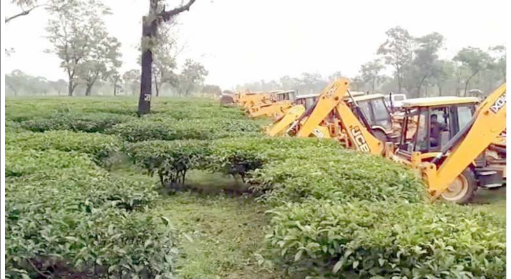
মীয়ামা যানিংদে হায়দুনা অকনবা মওংদা প্ৰোটেক্ট চখৰিঙৈ মৰক্তা কছাৱ এদমিনিষ্ট্ৰেশননা দোলু এৱিয়াদা লৈবা টি ইন্টেক্টিংদা মাস ইভিঙন চখবা হোখিবা

লাকখিবা লোক সভাগী স্পিকৰ ওম বিৱলনা মথা তানা হায়, দিমোফ্ৰেসি চংপা লৈবাক অসিদা দিমোফ্ৰেসিগী মহাউ খঙনা হিংবা ফংদ্রবদি মদুগী ভেলু লৈতে। মৰম অদুনা দিমোফ্ৰেসিগী ৰাখল্লোনশিং অসি মীপুম খুদিংদা মপুঙ ফানা লৈহবা মথো তাই। লৈবাক অসিগী মীপুম খুদিংমক্কা দিমোফ্ৰেসিগী ৰাহন্তোক লোনা হিংবা গুণ্ডবদি লৈবাক অসিদগী মৰুওইনা এন ষ্ট ৱিজদগী লালহৌবা মুখংপা গুমগনি হায়রি