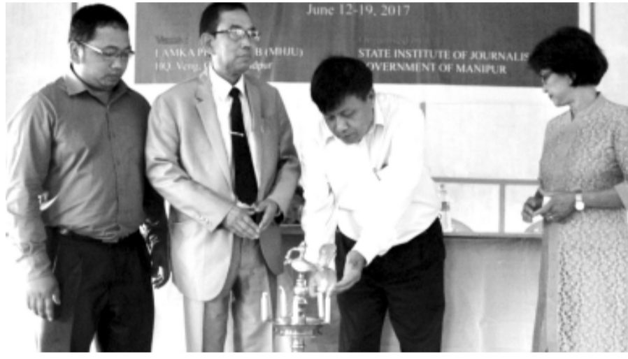
June 12-19, 2017. STATE INSTITUTE OF JOURNALISM AND MASS COMMUNICATION, IMPHAL.

ইফ্যাল, জুন ১২ (এচ এন এস) : নুমিৎ তৰেংনি চখগদবা নুজ্জ