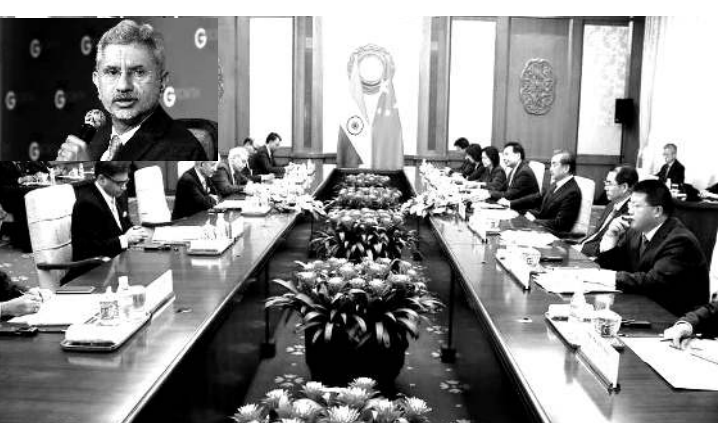
বৈজিং, ওগষ্ট ১২ (এজেন্সি) : ইন্দিয়া অমসুং চাইনাদা অমগা অমগা মোং তিগাবা রাফমশিংনা লৈবাক অনীগী ওইবা মরীদা অকায়বা থোকহল্লোইদবনি হায়না ইন্দিয়াগী এন্টর্নেল এক্সেস মিনিষ্টর এস জয়সঙ্করনা চাইনাদা মহাক্কা লেংমায়বা...

রাং মিল ফোওদোকখ্রে। কাশ্মিরগী মতাংদা ইন্দিয়া লৌখলক্কা মোংখোংবু বৈজিংনা য়ানিহনবা ফোওদোকপা লৈরিঙে চৈরক্তা নিংখৌকাবা নুমিত্তা বৈজিং তদা মথোয় অনীনা উনখিবা মতমদা জয়সঙ্করনা রাং মিল রাফম অসি থমখিবনি।