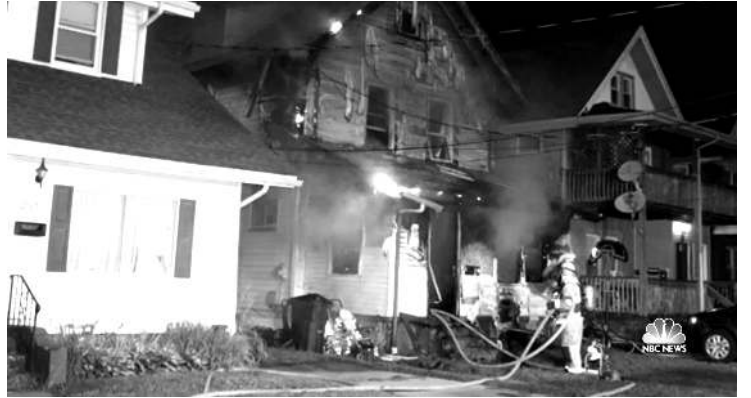
রাশিগটন, ওগষ্ট ১২ (এজেন্সি) : যু এসকী পেনসিলভেনিয়া স্টেটতা লৈবা দে কোর সেন্টর অমা মৈ চাকপদা য়ামদ্রবা অঙাং ৫ শিরে হায়না...

রাশিগটন, ওগষ্ট ১২ (এজেন্সি) : যু এসকী পেনসিলভেনিয়া স্টেটতা লৈবা দে কোর সেন্টর অমা মৈ চাকপদা য়ামদ্রবা অঙাং ৫ শিরে হায়না লোকেল ওথোরিটিশিংনা ফোওদোকখ্রে।