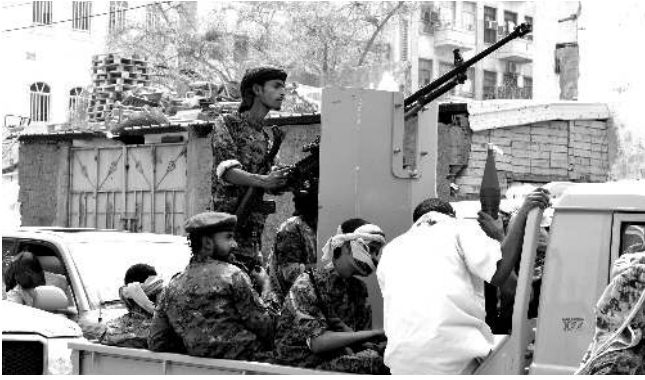
কাইরো, ওগষ্ট ১২ (এজেন্সি) : সাউদি অরাবিয়ানা লুচিংবা কোলিসন্নায়়েমনেগী অদেন্দা সীজফয়ার থল্লাবা আপিল তৌথ্রে।

কাইরো, ওগষ্ট ১২ (এজেন্সি) : সাউদি অরাবিয়ানা লুচিংবা কোলিসন্নায়়েমনেগী অদেন্দা সীজফয়ার থল্লাবা আপিল তৌথ্রে। সাউদি অরাবিয়ানা লুচিংবা কোলিসন্নায়়েমনেগী অদেন্দা সীজফয়ার থল্লাবা আপিল তৌথ্রে।