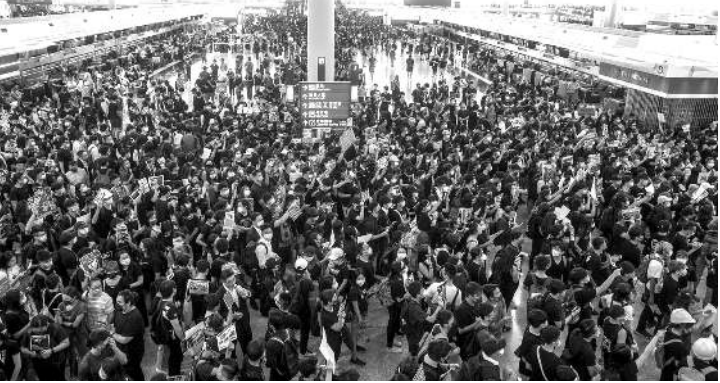
হোং কোং, ওগষ্ট ১২ (এজেন্সি) : হোং কোং এন্টি-গভর্নমেন্ট প্রোটেষ্টশিং ওক্কাই ওইবা মওংদা খংকন কনশিল্লকখিবগা লায়ননা দেমোনষ্ট্রেটর ময়ান্না সিটি অদুগী এয়রপোর্টকী এরাইভেল টর্মিলে কন্ট্রোল তৌশিনখিবদগী এয়রপোর্ট অসিনা নিংখৌকাবা নুমিত্তা ফ্লাইট...

পুয়মক কেঙ্গেল তৌথ্রে। চৈরকসিদা বৈজিংনা চাইনিজ ওফিসল অমনা এসিয়ানী ফাইন্যান্সিএল হব অদুদা টেব্রিজমগী খুদম-চাংদমশিং লাকপা হৌরে হায়না চেকশিনরা ফোওদোকখ্রে।