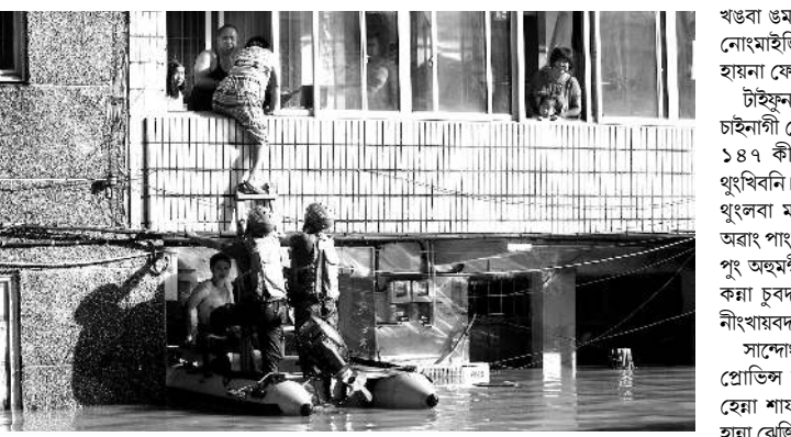
বৈজিং, ওগষ্ট ১২ (এজেন্সি) : টাইফুন লেকিমানা চাইনাদা নোংপোক থংবা সমুদ্র খোংবান্দা মখা তানা দৌলর বিলিয়ন কয়ামুকী ওইগদবা মাল-চাংশিং মাওহন-তাকহনখিবগা লায়ননা নিংখৌকাবা নুমিংকী অয়ক ফাওবদা শাখিগা নোংখৈ নুশিং অদুনা মরম ওইহন শিখিবা মী মশিং লমদম অদু ৪৪ যৌথ্রে হায়রি।

প্রোভিসিএল ইমার্জেন্সি ব্যুরোশিংগী দেতা অমসুং স্টেট মিদিয়াগী মতুং ইয়া বেজিং য়াং প্রোভিসিওন মীওই ৭ অমসুং সান্দোং প্রোভিসিওন মীওই ৫ য়াওনা শাখিগা নোংখৈ নুশিং অদুদা অহেনবা মীওই ১২ শিবগী রিপোর্ট লাকখি।