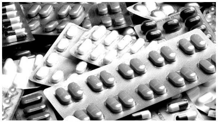
লাক্কা বদি হায়দুনা পোংশকশিং অদুবু ফ্লাইট কয়াদা পুথোক-পুশিন তৌনবা অঙাং এয়রলাইন কেম্পানিটি রিজর্ভ তৌনখ্রে হায়রি।

ব্রসেলজ, ওগষ্ট ১২ (এজেন্সি) : ব্রুটোয়া যুরোপিয়ন যুনিয়ন থাদোক্কা বগী ওভেবর ৩১গী মতম নকশিল্লকখিবগা লায়ননা হেইল্ট প্রোফেস্সেলশিংনা দিল যাওদবা ব্রেজিল্টকী ফিভম লাকপা মতমদা যুরোপা হীদাক লাংথক্কা খরা মরাং কায়না ফুদবগী ফিভম অমা লৈরিবসি হোয়া লুশিনহনগনি হায়না বারিং তৌরি।