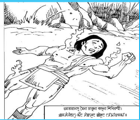
কৈনু: ষ্টোৱি অমসুং আৰ্ট: সামসন সলাম. মধ্যৰাত্ৰী উত্তৰ তাম্বুনা চিংলৈলী মকেজা খোৱগী। অমদি চিলাইনু মনিং চেংগোভুনা শিৱিৱগী।