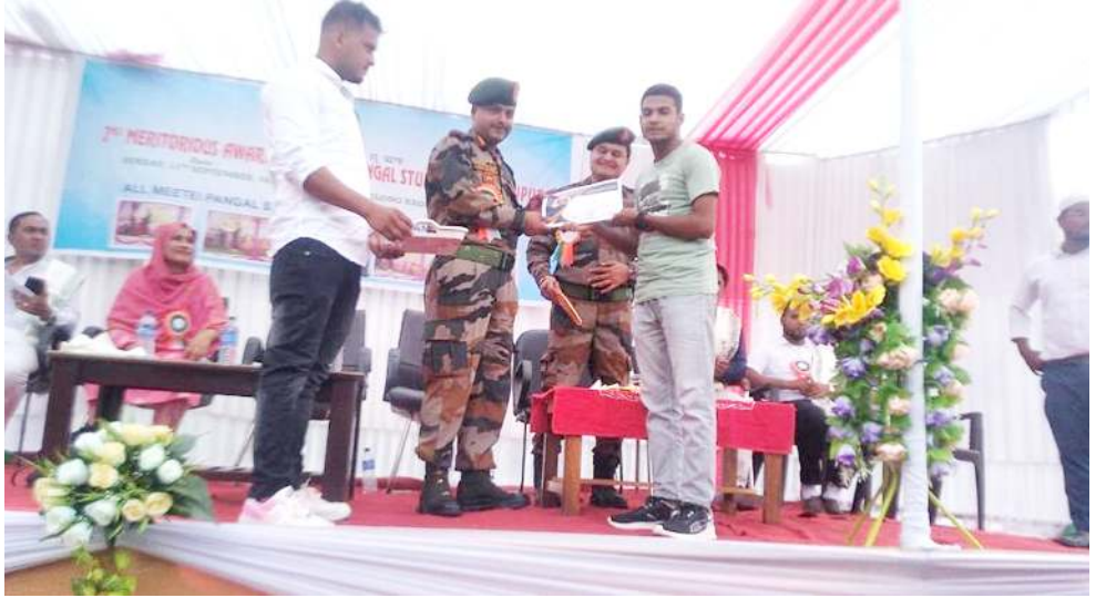
কেথেলমানৰী বটায়িন অসাম ৱাইফলসনা শিন্দুনা লিলোং হাউৱেবীদা পাঙথোকখিবা ক্লস টেন অমসুং ফ্ৰেণ্ড মাৰ্ক ৱাংনা ফংলকপ্তৰা মইহোৱাশিং তৱাম্মা ওকপা

মহাক্সা মখা তানা ফোঙদোকখিবদা, স্টেট ফ্লেট কোৱ স্কিমগী মখাদা বেনিফিসিৱশিংদা ফংহনগদবা লুপা ফ্ৰোৱ ৭৭ কী শেনফম হৌজিকসু লৈঙাক্সা পীথোঙনা লৈরি। মখোয় মখোয়গা নক্সা কল্লেষ্টৱশিংনা থবক শুখিবগী শেনফম হাৱা পীথোৱা হোংনৱিঙদা গভৰ্ণমেণ্ট ইমপ্লোয়িমেন্ট থাগী তোলোব মতম চানা পীথোকপা ওমদ্রে। মসিনা মৰম ওইৱৰগা স্টেট অসিদা লৈরিবা দুশিং মেনখংনবা হোংনবদা অফকা লোন খুদিংমক লৌনবা হোংনৱক্লি। মসি ৱাৱা লাইবক থিবা থৌওংনি। মৰম অদুনা মীয়ামগী খন্দবা লৈঙাক্সা অসিৰু মীয়াম্মা পৱা তন্ত্ৰীবগী মতম ওইৱে।