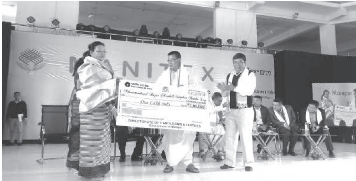
মণিপুর ট্রেড এন্ড এক্সপো সেন্টরদা পাণ্ডথোকখিবা এক্সপোর্ট এন্ড ইমপোর্ট ডেপী থৌরমদা ফিশাৰীশিংদা মনা লাছোকপগী শতম