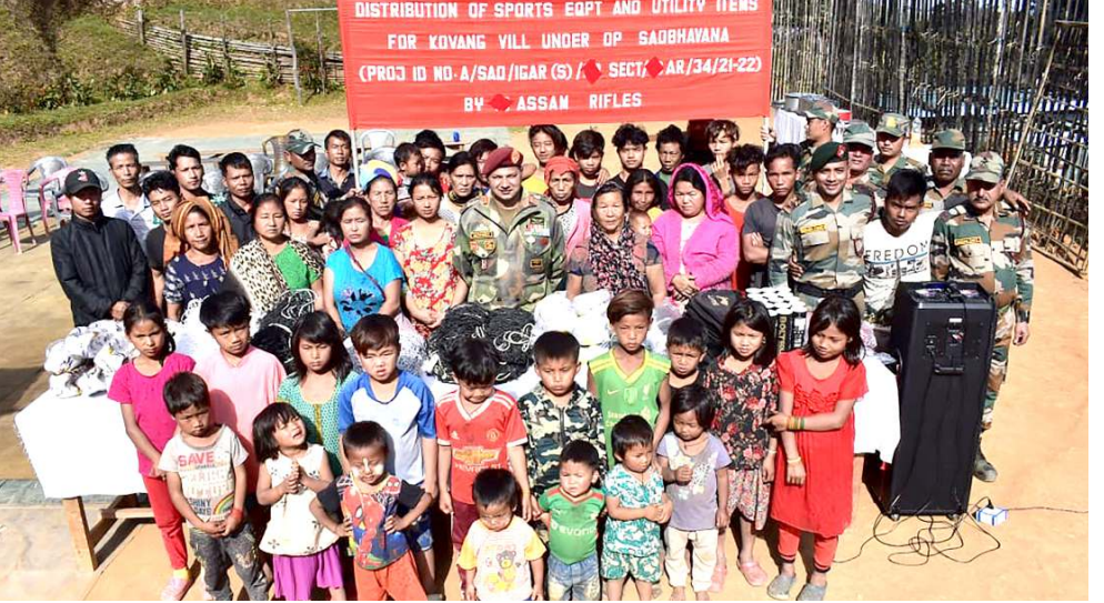
আই জি এ আৰ (সাউথ)কী মীংয়েং মখাদা সেহলোন বটালিয়ননা চান্দেল দিল্লিজকী কোভা: ডিলেজনী খুঞ্জাশিংনা স্পোর্টসকী আইটেমশিং ৰেছোৰ্চখিবা

ইটানাগৰ, জুৱাৰী ১৩ (এজেক্সী): অৰুনাচল প্ৰদেশতা অনৌবা কোভিড-১৯ পোজিটিভ ওইবা মশীং ১৩২ থেংনবদনী নাৰ্থ ইষ্ট ষ্টেটশিংদা পূৰ্বা কোভিড-১৯ পোজিটিভ ওইবা মশীং ৫৬,০১০ শুৱে হায়না সিনিয়ৰ হেইট দিপাৰ্টমেণ্টকী ওফিসল অমগী পাউনা হায়ৰি। হেইখিবা পুং ২৪গী মনুংদা কোভিড-১৯না ময়ম ওইদুনা হেইজিক ফাওবদা শিবগী মশীং অসি ২৮২দা লৈৱি হায়না ষ্টেট সৰ্ভেলেঞ্চ ওফিসৰ লোবসং জ্পানা ফোঙদোক্কখি। হেইখিবা পুং ২৪ ফাওবগী মনুংদা থেংনখিবা কোভিড-১৯গী কেস অসি সেন্টেল কমপ্লেক্স ৰিজনদা