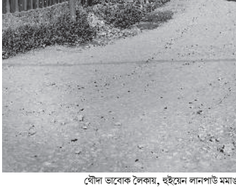
খৌদা ভাবেক লৈকায, হুইয়েন লানপাউ মামা