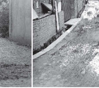
হাওবম মৰক কাংজম লৈকায