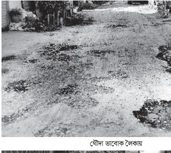
খৌদা ভাবেক লৈকায