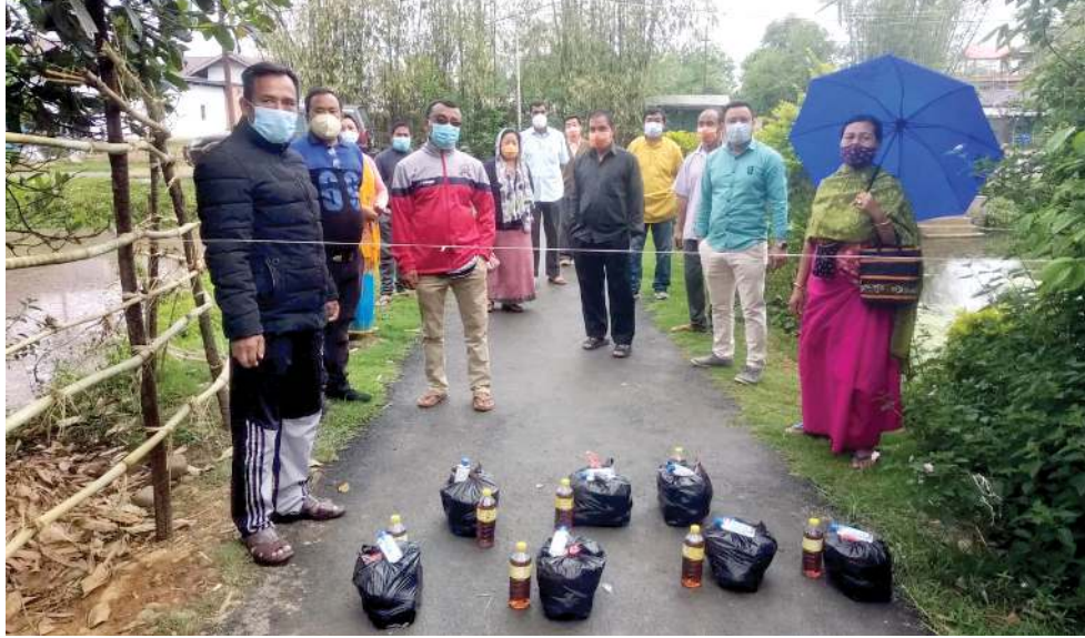
বি জে পি মণিপুরী স্টেট কাউন্সিল মেম্বৰসু ওইরিবা কোভিড সেকেন্দ বেড ফাইফি টাঙ্গ ফোর্স লমলাইগী চোরমেন খোংবানতাবম ইবোমচানা লমলাই এ সী মনুং চা লৈবা কণ্টেনমেন্ট জোন লাউখোক্সবা মফমদা লৈবা মীওইশিংদা চানা থক্ৰা পোংলমশিং থেংবাং পীখিবা

শিলোং, মে ১৩ (এজেন্সী): হৌখিবা পুং ২৪ গী মনুংদা মেঘলয়াদা কোভিড-১৯ গী অনৌবা কেস ৫৯১ থেংনখিবাগা লোয়ননা হায়রিবা মতম অসিদা লায়না লাইচং অসিনা মীওই ১৮ শিহনখি।