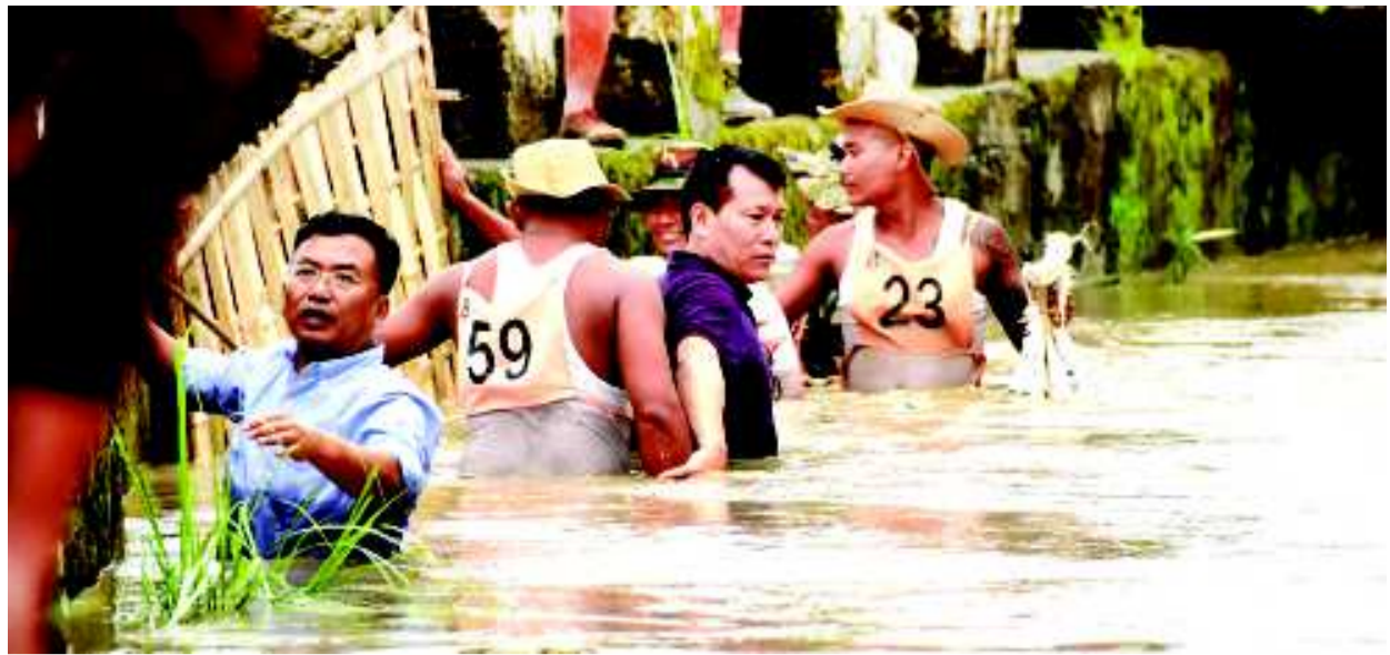
ব্যাটলিং রিহোসেস মিনিষ্টর লেটপাও হাওকিপ অমসুং কম্পিটর এচ দিলিপ য়াওনা ওফিসলশিংনা ইম্ফাল ডুরেলগী তোর্বান কায়াবা মেনবদা শরুক য়াও

টোপাংখোঙ/খোঙ হান্সা খুদিংগী অমাঙথোং ময়াদনী ঙি কাপথোরকপা, অমাঙথোং ময়াদা পোমথোঙলা লৈবা, খোঙ হান্সা মতমদা অমাঙবদু অকনবা ওইনা হান্সা অমাঙথোঙা অকোয়বদু তংলগা য়ান্না থুপ্পা অমদি শাবা, খাঙ নাবা, মরক মরক্তা য়েংকী খুং, খোঙ শিখগে তৌরকপা ফহনবগী ওজা জিয়া উল হগ-পু থাংগচরি