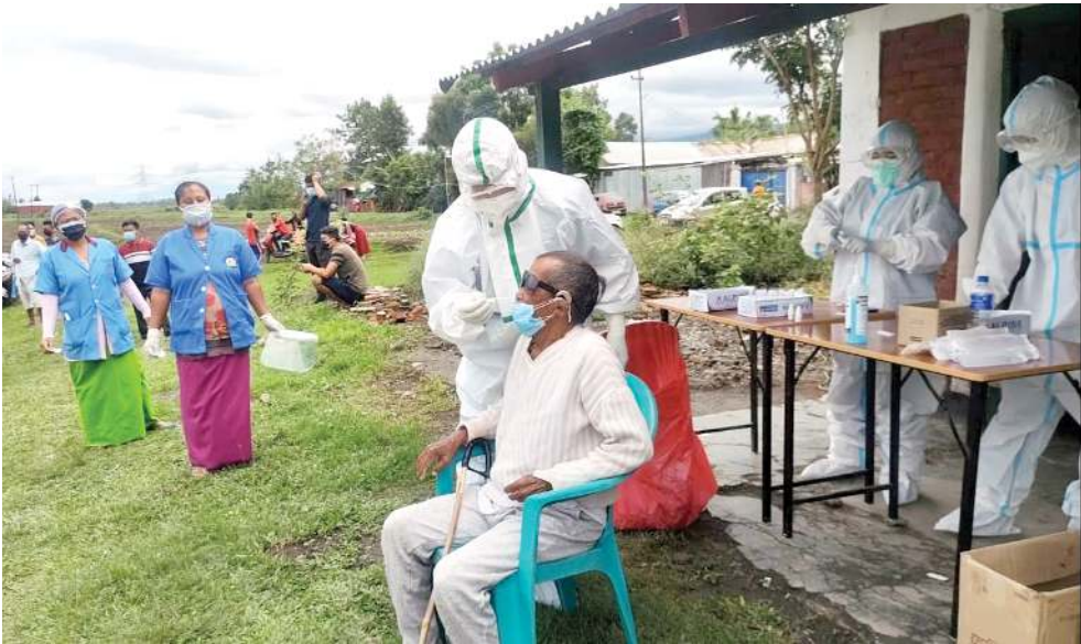
সেকমাই এ সীগী এম এল এ এচ দিঙ্গো লমজিং মখাদা সেকমাই কোভিড-১৯ ষ্টেট লাইন ৱাৰিয়ৱ গ্ৰুপ অমদি ইফাল ৱেষ্ট দিষ্টিক্কী চীফ মেডিকেল ওফিসৱগা খুংশুৱগা লাইৱেন সজিক অমদি তেৱা জুজাৱ ৱেপিদ এণ্টিজেন্ট টেষ্ট (আৰ এ টি) মোবাইল টেষ্টিং পাণ্ডথোকপা

অমদুগী খুদোংচাবা লৌৱগা যণনশিং পুদুনা লাকখিবা মীওইশিং অদু মফম অদু থানোতুনা চেনথ্রে। থোদোতুনা নাকল অনীগী মৱতা অশোক অশন অমত্তা থোকখিদে। পুলিসনা মখা তানা মফমদুনা চঙশিন্দুনা য়েংলবদা মণুং মৱৈ ফাৱবা যণ ৩০ যণশিং অদু ধুৱি পুলিস ষ্টেশনদা পুৱতুনা থনি হায়রি।