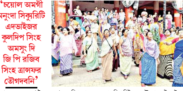
ইম্ফাল, জুন ১৩ (এইচএনএস) : মণিপুরদা খোক্রিবা নাকো টেরিষ্টাশিংগী লানগী লাজেং অসিদা ইন্দিয়া লৈঙাকী অচৌবা মতেং পাংলি হায়বসি মীয়ায়লা খঙনরে হায়দুনা তেওটকী মতমদনা কুকিদি স্টিচ ওফ তৌরগা ভেট লৌইরবা য়েহেহেল্লদা ফোঙদোকখিনি। মহাক্সা মখা তানা হায়, চীফ মিনিষ্টরনা রুল ওফ জেইন্ট কোর্ডিনেটিং কমিটি ফোর পিছকী কনভিনর য়ুয়াম ...মখা লমায় ও কলম ৪

ইন্দিয়া লৈঙাকী যাকা য়েংলগা নোকফেং তৌরগা ফমগদবা ওইরবদি চৌক্ৰি থুদেক্লেগনি : মেম্মা