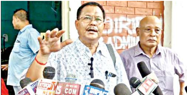
জিরিবামদা পাঙথোকপা পাউজী মীফমদা জে দি-য়ুগী লুচিবশিংনা বা ডাঙবা

চীফ মিনিষ্টরনা রুল ওফ লো লৈহনগনি হায়খিবদু থবক্তা ওল্লোকপীয়ু : জে দি-য়ু