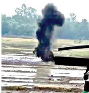
কাংভাইগী লৌবুক অমদা তারম্বা বোম অমা এক্সপার্টিশিনা পোকখায়হনখিবা

কুকি টেরিষ্টাশিংনা থম্মাপোকপীদা বোম অমদি নোংমৈ কাপশিল্লকত্রে