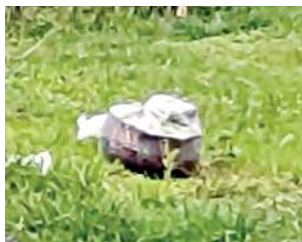
জকুরাখোর পাট-২ দা কুকি টেরিষ্টাশিংনা প্লান তৌরবা বোম

জিরিবামদা বোম কাপশিন্দুনা য়ুম থুগাইঙে, খাওদা বোম হাপ্লগা থম্মে