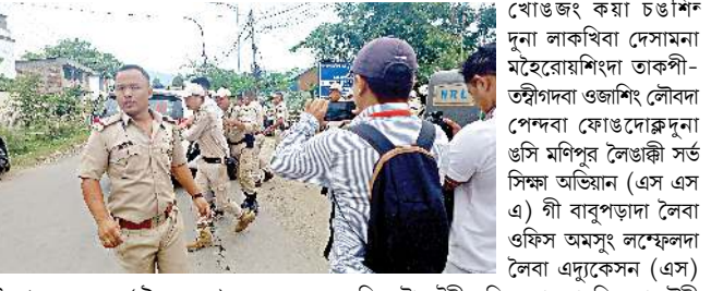
ইম্ফাল, জুন ১৩ (এইচএনএস) : মতিং লৈবা মণিপুরী য়ুয়াই অমা ওইহমাবগী পান্দমদা মইরোয়শিংদা কালিটি এদ্যুকেসন ফংহনগদবনি হায়দুনা তেঙান তেঙানবা খোঙজং কয়া চঙশি দুনা লাকখিবা দেসামনা মইরোয়শিংদা তাকপী- তম্মাগদা ওজাশিং লৌবদা পেদম্বা ফোঙদোক্লেদুনা উসি মণিপুর লৈঙাকী সর্ভ সিদ্ধা অভিযান (এস এস এ) গী বাবুপাডা লৈবা ওফিস অমসুং লম্ফেলদা লৈবা এদ্যুকেসন (এস) দিরেক্টোৱেটকী ওফিস ছো লোনশিল্লবদা থৌমী অহম পুলিসনা ফাজিনছে হায়রি। বাবুপাডা লৈবা এস এস এ লোয়শঙগী ছো উসি অযুক পুং ১১ ...মখা লমায় ও কলম ৭

দেসামনা এস এস এ অমসুং এদ্যুকেসন এসকী লোয়শঙ ছো লোনশিনবদগী থৌমী ও পুলিসনা ফাত্রে