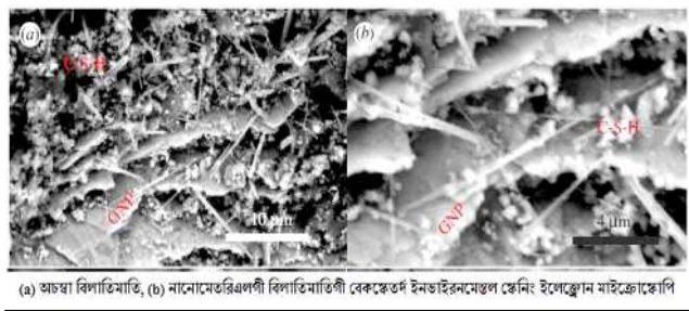
(a) অচয়া বিলাতিমতি, (b) নানোমেটরিএলগী বিলাতিমতিগী বেকক্লেও ইনভাইরনমেন্টল শেংনিং ইসেক্সোন মাইক্রোস্কোপি