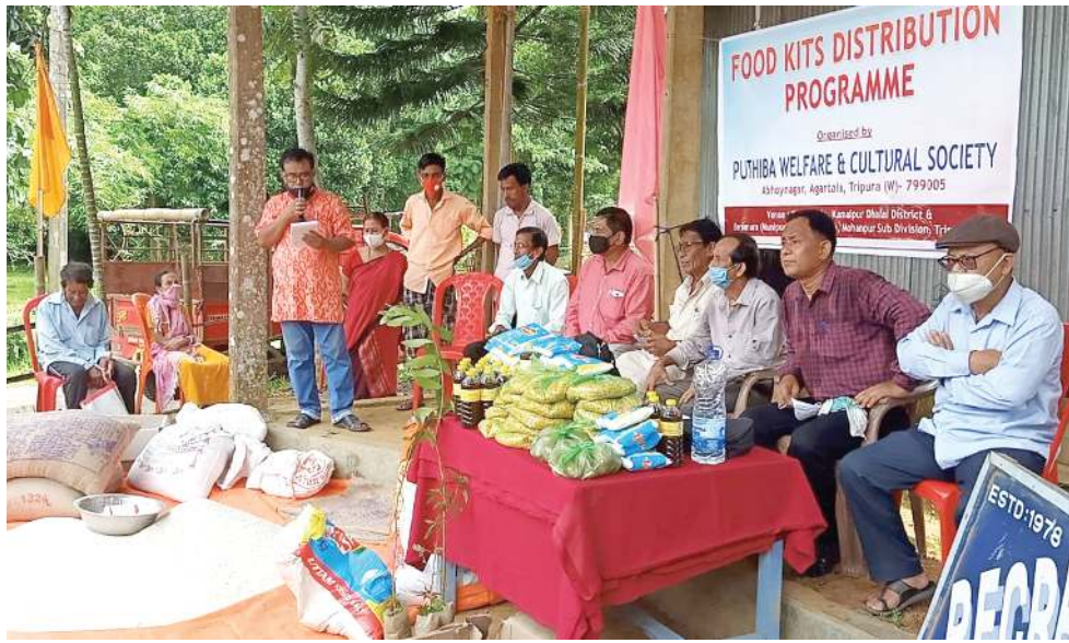
মালেমগী ওইনা মীপায়নিংগুই ওইয়ৰগা কোভিড-১৯ লাইচংনা ময়ম ওইয়না ত্ৰিপুৱাদা অৱাৰা তাৰবা মীতৈ খুংখ্ৰশিংদা পুথিবা ৱেলফেৰ এন্ড কলচাৰেল সোসাইটীনা ৱেৰিমুলা ৱিক্ৰেচন ৱেলফেৰ মতেং লৌৱগা ৱেৰিমুলাদা পাঙথোকপা খৌৱমদা চানা থলুবা পোংলমশিং য়েছেকখিবা

অসিনা ময়ম ওইয়ৰগা মীওই ২৩ শিহনখ্ৰবসু মীওই চা কয়া মপুং ফানা ৱিকোভৰ তৌবা গুম্বাৰে। ষ্টেট অসিদা কোভিড-১৯ ৱিকোভৰ বেট অসি চাদা ৯৫.০৭ ওইরি। অমরোমদা লৈবাক ষ্টেটশিংদা কোভিড-১৯ লায়না লাইচং কা হেমা শন্দেৱক্ৰিবা অসিগী য়েংলগা প্ৰাইম মিনিষ্টৰ নৱেদ্রে মোদিনা নোৰ্থ ইষ্ট ষ্টেটশিংগী চীফ মিনিষ্টৰশিংগা জুৰুয়েল ওইনা ৱাৰী শাৱপ্ৰে। নোৰ্থ ইষ্ট ষ্টেটশিংগী মনুংদা ষ্টেট খৱদি হৌজিক হৌজিকসু কোভিড-১৯ লায়না লাইচং শন্দোকপগী চাং কল্লাল তৌবা গুম্বনা লৈরি।