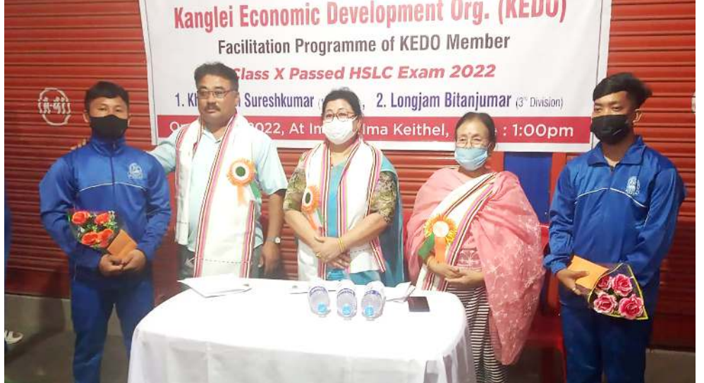
বোসেনা লৌবা এচ এস এল সী এগজামদা ফাট দিবজিদা পাস তৌরকখা সুরেসকুমার অমদি থার্দ দিবজিদা পাস তৌরকখা পিতাঞ্জুমার কেন্দ্র অমসু নুপী কৈথেলগী ইমাইশিংনা জাম্মা ওকখিবা