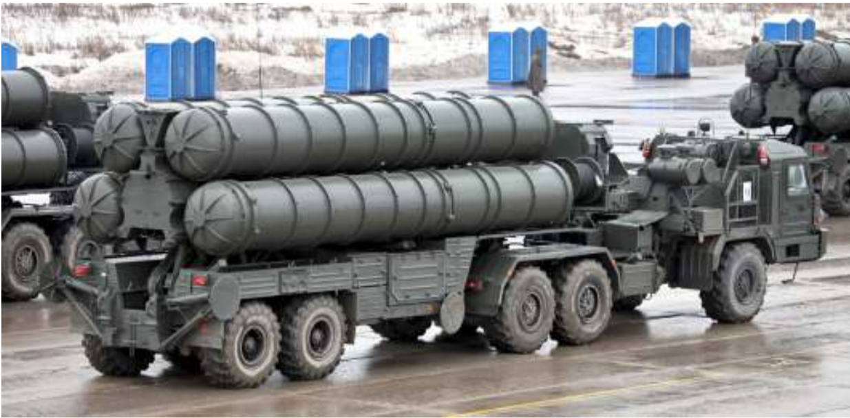
অমসুং রশিয়ন প্ৰসিদ্দেট ব্ৰাদিমিৰ পুটিননা এণ্টিমিষ্ট অৰু মখা চখবা হায়না য়ানবদা।

অন্ধাৰা, সেপ্টেম্বৰ ১৩ (এজেন্সী) : টৰ্কিনা রশিয়াগী এস-৪০০ এয়ৰ ডিফেন্স সিস্টেম লৈনবগী দীল অমা য়ানবদা নোংচুপলোমগী লৈপাকশিংনা নুংনাংবগী মওং টৰ্কিনা প্ৰসিদ্দেট টায়িপ ইৰ্গেগননা য়মশকৈশা নুমিংতা য়ানিংদবা ফোঙদোকথ্ৰে অমসুং নাটোগী মেম্বৰ ওইজববসু মহাকী লৈবাক্কা মশাগী সিক্যুৱিটি য়েংখিগুগনি হয়গ্ৰে।