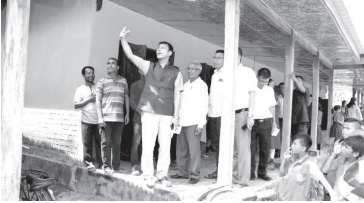
এদ্যাকেসন মিনিষ্টর খোকচাম রাশেশ্যামনা সদাইয়ুফম হায়র সেকেন্দরী স্থলগী ফিতম য়েংশিন্দুনা স্থলগী ঠাফকা অত্রাং-অপাগী মতাংচা বারী শামবা