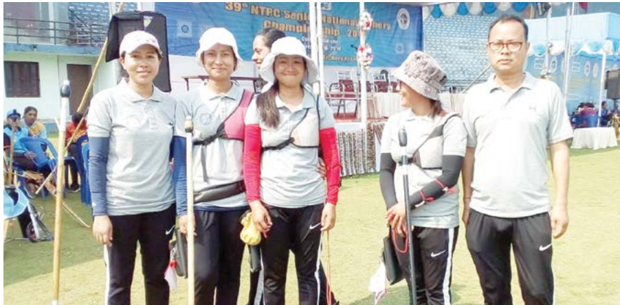
শেমজনিংই। খুংশু-খুংলায়, ইকুপমেন্টগী মতমসিদা অরাংপা খরবুদি অদম লৈরি। আর্চরিগী ইকুপমেন্টশিং অসিসু পল্লব সেটত লাখ অনীমক হেয়া তাবনিনা লৈনবা হোংনবদা অরাবা অমদি অদম ওই। কুমজা ২০১৩-১৪গী মতমদা কম্পাউন্ডগী মরি অমগা রিকর্ভকী নিপান অমগা, এরো খরগা লৈবিবদগী মখা লৌদি। এরো অসিসু হৌজিকী দ্রজন্দা লুপা লিংশিং কুস্তারক পীরে। অহানবা ওইনা আর্চরিগী ইকুপমেন্ট লৌবিবসি লুপা লাখ তরামকীনি। অদুগা ট্রেইনিং অসিদি কুইনসু চহেতে। মৌবী রা কায়বদীনা কায়। টেনিসি লেভু, টেঞ্জিগিদি চহী খুদিংগী লৈহনিংই।

লমতাকপীরিবা কোচশিং খজুদা ইহৌকপা অসিদি লানগনি খল্লি। ইমুং-মনুংগী পেরেকশিংনসু খরা কপা য়েংশিনমীমদনা শেম্মীয়বা অমদি চহীই। স্পোর্টস একাদমিদা লৈরিবনি, গভর্ণমেন্টকী মায়কৈদগী শেম্মা য়াবা শেমজরগনি খন্দুনা থওইদা মসিগুহসিসু এদি তৌহনজ নিংদে। একাদমিদা লৈরিবা অঙাংশিং খুদিংমক শায়বদসু ওইরো, লাইরিবসু ওইরো লোইনমক অচঙা মী ওইনগনি হায়বদি লৈতে। হৌজিক অঙাংশিং অমা মী ওইনবা শেম্মা হায়বসিসু অরাইবা রাফম ওইদে। অদুনা, ইচা-ইশুশিং মরক মরক করম তৌরিবগে হায়বসিসু য়েংশিনহমিই। শায়রিঙে, কোচিং তৌরিঙে মতমসিদসু মমা-মপানা, ইমুং-মনুং থরায় যাওনা য়েংশিনবা লাক্ক গদি অঙাংশিংদসু হেয়া নুংঙাইগনি থাকে। গেম খরগীদি থওইনা মমা-মপানা ট্রান্স তৌবদা শেম্মবগুম মচানা শায়বদা কুপশেন শেম্মদনা য়েংশিনবিবসি হৌজিক মগিপুরদসু খরা খরিদি তৌনরক্লে।