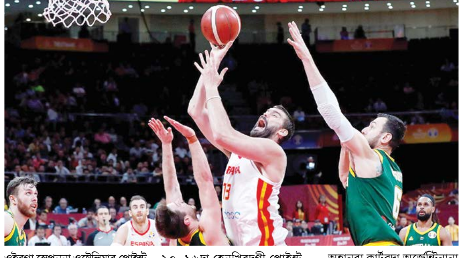
ওইরগা স্পেননা ওষ্টেলিয়ায় পোইন্ট ২২-২১দা হেনখি। অনীশুবা কাটরদা ওষ্টেলিয়ানা হেয়া ফজবা ওষ্টেলিয়ায় পোইন্ট ২৪-১৭দা হেনবদগী সেমি ফাইনেল মেচ অদু মায় পাঙুনা ফাইনেল যৌবা ওমখি।

সাংহাই, সেপ্টেম্বর ১৩ (এজেলী): চাইনিয়ান য়ুথু ওইদুনা লৈবাক অসিগী সিটি ৮দা মমাঙ থাগী ৩১দগী চখরকপা বাস্কেটবোল বর্ল্ড কপকী ওসি শায়খিবা সেমি ফাইনেল মেসিফিং স্পেন অমসুং অর্জেন্টিনা মখায় মখায়গী লম্বা মায়খিবা পীদুনা ফাইনেল যৌদুনা চেম্পিয়ন ওইনবগীদমক থা অসিগী ১৫দা লম্বা তৌনরগনি।