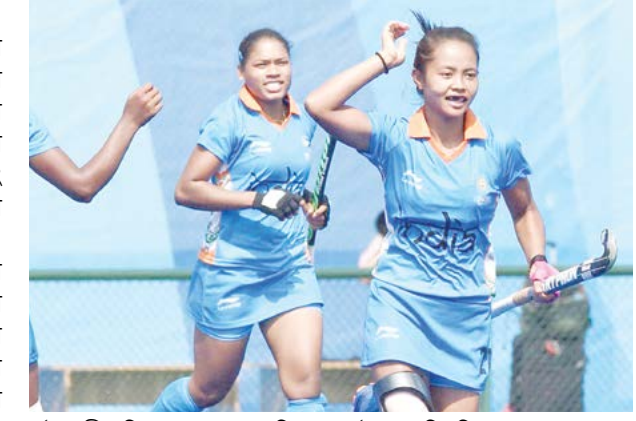
ওইরগী মগিপুর চা পুস্ত্রম সুসিলা চনু য়াওবে। ইন্দিয়াগী নুপীগী হৌকি টিম অসিনা ইংলেদগী টুর অদু লৌইরিবা মতুং চহী অসিগী নভেশ্বর থাদা ইন্টারনেসনল হৌকি ফেদরেশনগী লমজিং মখাদা পাঙথোকদৌরিবা ওলিম্পিক কালিফায়রদা অকনবা মওন্দা শরুক য়াগদৌরি।

ন্যু দিল্লি, সেপ্টেম্বর ১৩ (এজেলী): হৌকি ইন্দিয়ানা ও সি থাদোরকখিবা চেবোল অমদা ইংলেদনা হৌকি টিম অমা ইন্দিয়াগী নুপীগী হৌকি টিমগী শায়রোয় ১৮গী মমিং লাউথোকপদা মমিং লৈরিবা মগিপুর মচা পুস্ত্রম সুসিলা চনু য়াওবে।