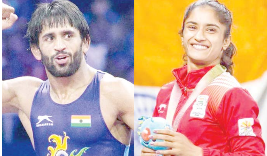
মখংগীচহীদা জাপাননা য়ুথু ওইদুনা লৈবাক অদুগী সিটি টোকিওদা পাঙথোকখিবা ওলিম্পিক গেমসত রেপ্টলিং দিসিপ্লিনদা কালিফাই ওইনবগীদমক মালেমগী তোঙান-তোঙানবা সিটিদা পাঙথোকখিবা ইন্টারনেসনল রেপ্টলিং চেম্পিয়নশিপ্তা ইন্দিয়াগী রেপ্টলর কয়া শরুক য়ারি।