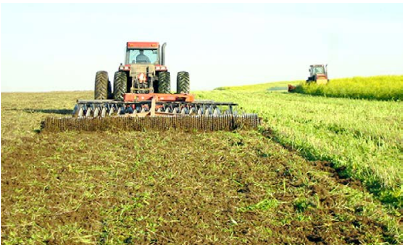
দুনা লৈবাক্তা হাপচিবা গুম্মা পান্হীশিং অসি য়াল্লমক মরু ওই। অসুম্মা লৈহাও কারবা অমদি লৈশা ফগংলবা লৌফমদা থাবা পান্হীশিং চাথোক নিংখিনি পীবা গুম্মী, শেদোং লৈহল্লি, তুং

লৈবাক লৈহাও মাওদনবা থল্লবা হোংনবা হায়বসি লৌমী ইচিন-ইনাওশিংগী ঝাইদগী তঙইফদবা, অদুবু অরানবা অমদি ওইবা থৌরমনি হায়বা তাই। অদুবু লৈবাক লৈহাও মাওদন