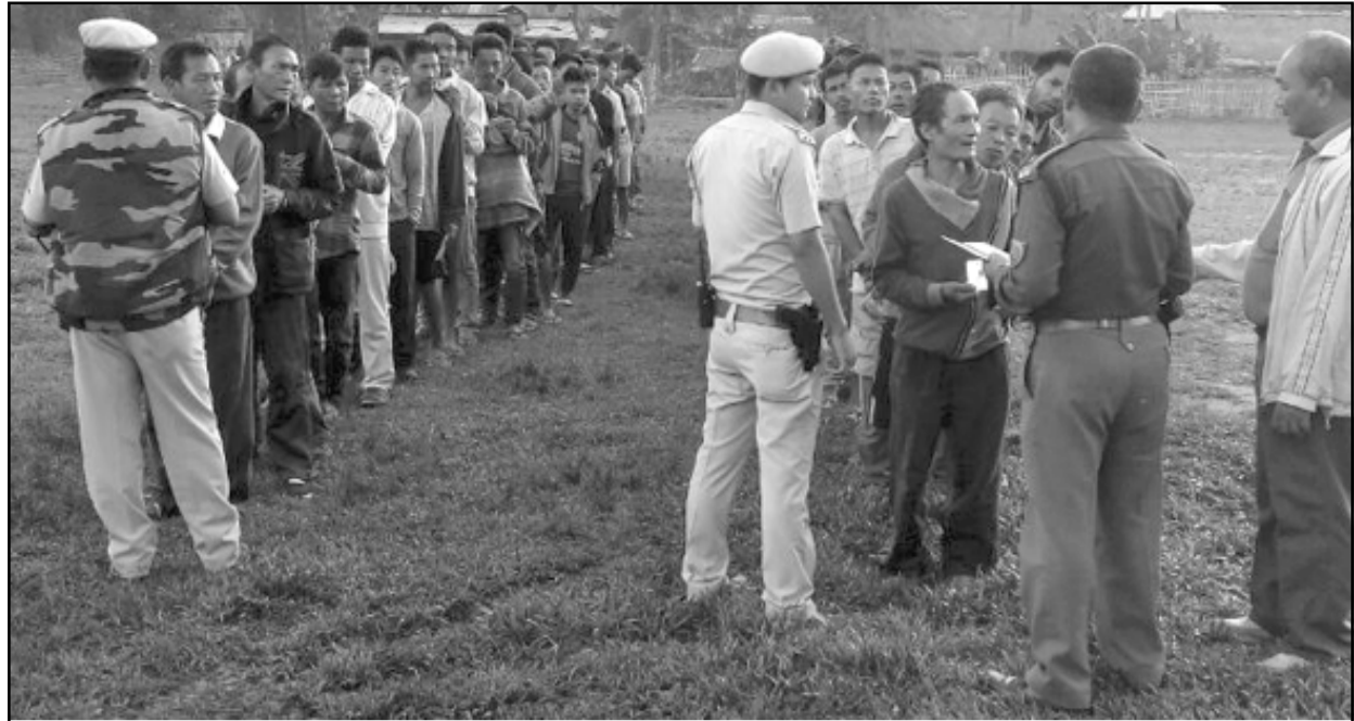
শঙই ফেষ্টিভেলগী মাঙওইননা পামদবা খৌদোক খোকপগী পাউ তাহন্দনবগী পামদমা জিরিবাম ডিষ্ট্রিক্ট পুলিসকী কাঙবুনা ওপরেসন চখাবা

টোপাং/অমাঙথোংদা মরেন মরেন চংলগা য়ায়া হাক্চবা, অমাঙথোং মনুংদা মতম অনি লৈরগা খোঙ হান্না খুদিং ঈ দ্রোপ দ্রোপ তারকপা, খোঙ হান্না চাং নাইদবা, অমাঙথোংগী অকোয়বগী মপান্দা শারেন-গুন্না তংলগা লৈবা, য়েংকী খোঙ-খুং নাম্মা শিখবা, পুকচেপ্তা নারগা শাবা ফহনবগী ওজা Zia-UI-Haque পু থাগচরি