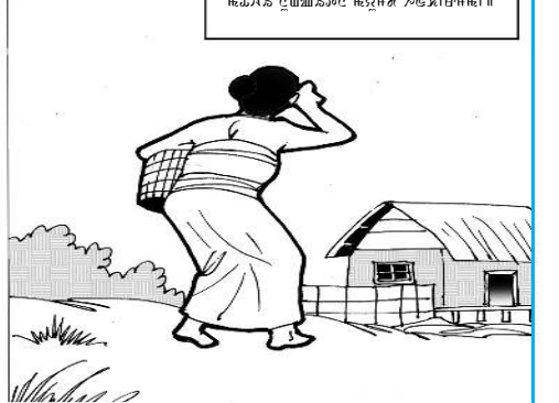
মগী নুওইতনা ময়ুদা হনবিশী। ঞাংগাং ঞাংগাং ঞাংগাং, ঞাংগাং ঞাংগাং ঞাংগাং।

IN THE COURT OF SUB-DEPUTY COLLECTOR, KUMBI, MANIPUR. Ref :- Mut Case No. 7391/SDC/Kumbi/2019