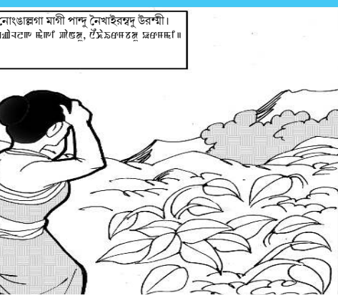
নোংগাংগাং মগী পান্দু নোংইরমুদু উরশী। ঞাংগাং ঞাংগাং ঞাংগাং, ঞাংগাং ঞাংগাং ঞাংগাং।