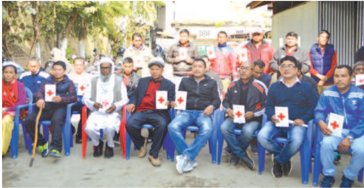
রিমসতা ইন্ডিয়ান রেড ক্রস সোসাইটি, মণিপুর স্টেট ব্রাঞ্চনা স্টেট অসিগী বেনিফিসরি ২০ দা লেয়া খুংশেমগী খোঙ হাপখিবগী খৌরম

আমাঙথোং ময়াদা সিরিজনা কাপগুয়া ঈ কাপথোরকপা, আমাঙথোং ময়াদা পোমথোরকপা, খোঙ হায়া চাং নাইদবা, খোঙ হায়া মতম কুইনা চংবা, আমাঙথোংগী অকায়বদা মরেন্ মরেন্ চংলগা হাক্চংচবা অদুগী মতুংদা আমাঙথোং মনুংদগী তিনকুপ থোক্চকপা ফহনবগী ওজাবু জিয়া উল হগপু থাগৎচরি