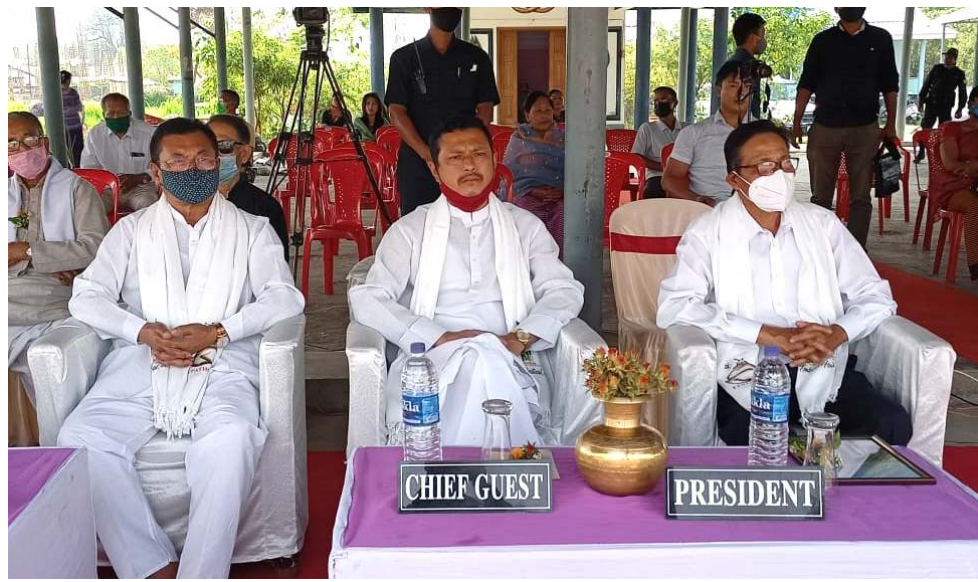
ইয়া যৌকোৱা শীপুনা লফেলনা লৈবা ইপা যৌকোৱা শঙলেনাদা নুমিৎ নীনি চুপা পাঙথোক্তনা লাকথিবা কোৱীৰে ফেট্ৰবেল ২০২১ কোৱীৰে হোংবা যৌৱম লোইশিনবা নুমিত্ৰা মফ ওইবা মীথংলেনশিং ওইনা শৰুক য়াথিবাশিং