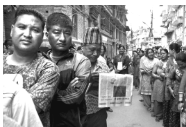
খনখি অমসুং মথোয়গী চহী মঙাগী টানশিং অদু শাখিরাবা মা ওইষ্ট লালহৌবা কল্লিঙে মতমদা লেইশিনিখি।

কথমন্দু, মে ১৪ : চহী ২০ গী মনুংদা পাঙথোকপা নেপালগী অহানবা লোকেল ইলেক্সনদা মীয়ায়লা নোংমাইজিং নুমিংতা ভোট খাদনশ্রে। মীয়ায়লা ভোট খাদনবিবা অসি লৈবাক অসিনা অকবা যৌকদা রাথোক কয়্যাগা ঈরায়ননা দিমোক্রেসিডা খোঙদারকপগী খাইদগী মক ওইবা পুংফমনি হায়না লৈনরি।