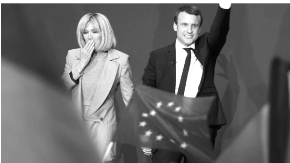
কোদাশিং শিমবগী রাফমসু য়াওখি। মেক্রোননা অনীশুবা লাঞ্জাউ মতুংগী ফ্রান্সকী খাইদগী নহা ওইরিবা লিওনিন অমসুং প্রসিডেন্ট চার্ল গোলনা মঙাশুবা বিপলিক চংনহনখিবা চহী

পেরিস, মে ১৪ : মে ৭ কী মীখলদা চাউনা মায় পাকথোক মতুংদা পেরিসতা লেবা এলিজী পেলেস প্রসিডেন্সিয়াল বেসিডেন্সতা পাঙথোকখিবা নিংখিরাবা রাশক লৌবগী খোরম অমদা সেনত্রিষ্ট ইন্মান্যুঅল মেক্রোননা ফ্রান্সকী প্রসিডেন্ট ওইনা রাশক লৌশ্রে।