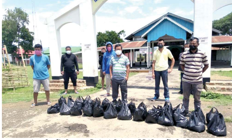
লমলাই এসেমব্লি কমিটিয়েলিগিদা হোম কাৰেণ্টিন তৌদুনা লৈরিবা ইমুং ১৩৩ গী মীওইশিংদা কমিটিয়েলিগি অদুগী সোসল বাৰ্কৰ সাপম কলপালনা খুংশিমরকপা চানা থৰুবা পোংলমশিং লমলাই মপাৰি যৌগল লুপকী যৌমীশিংনা য়েছোকখিবা

দিগবোই, মে ১৪ (এজেক্টী): অসামগী মনুং চনবা টিনসুকিয়া দিষ্টিক্টকী দিগবোইদা লৈবা টিগ্ৰাই বজাৰনা থোকখিবা বোম পোকখায়বগী খৌদোক্তা শিখিবা মশীং ২ শুখ্ৰে হায়না পুলিসকী মায়কেন্দিগী ফোঙদোৱক্ৰি।