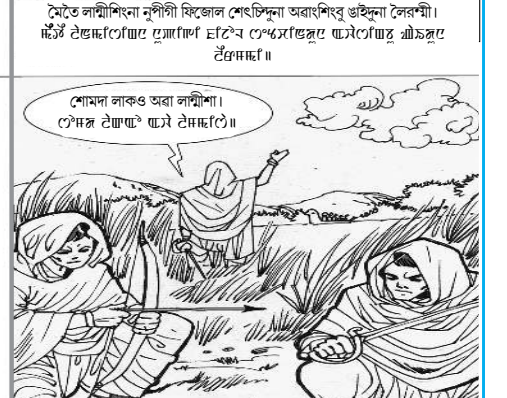
শোৱনা লাকও অৱা লম্বীশা।