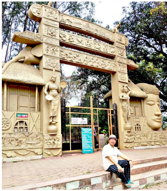
অইবনা হেৰিটেজ পাৰ্ককী গেট মমাঙদা পোখাবা

হন্দকী খোরিৰোল খোঙচংসি অদুৱা য়াংদুনা ষ্বাইদগী স্মাট ওইৱল্ল। মীওইবা কৌবনিবা থাংগলদি অদু হাৱাওবনি। বঙ্গালিনা হায়বা অমা লৈ 'থাংগপসি শেল তিংদে, মৰুপ মশীং হেনগলংকপনি'। এথোয়না লৈৱিবা সহিদ ভগট সিংহা মুখ হোটেলদু যৌৱে। এথোয়না হল্লকপদি ওইনাম চিত্তৱঞ্জনাগা সোৱাখাইবম দেবেদ্রোগদি ফিৱাল শেংললে। এথোয়না হেৰিটেজ পাৰ্ক চংলুৱে হায়বদুনা হংলশ্মী চিত্তৱঞ্জনাগা কদোমদা চংপনা থুগদগে, এনা য়ায়া খঙবগী মগুন্দা শোমদা অসু'মাইনা চংলু হায়দনা তাকপীখি অদু ওহোৱা থুনা হল্লকই যৌৱে হায়দুনা। মথোয়সু ফোটো ফনয়াম নলুকই। এথোয় মথং-মথং ইকজৰকৰে। মতাংসিগা এনা পল্লীংবা অমদা ফজপ্ৰবা চাউৱবা হোটেলসি দিঙইনি তৌৱিবা আৰ্কিটেক্টকী অশোয়ৱা, ইঞ্জিনিয়াৰিংগী অশোয়ৱা পীকক্ৰ পীকপা থোঙ হাফম ৱৰিমুক লৈ অদুৱা ft 4'x4' মুক্ত চাউবদুনা থোঙমায়সু মনুংদা হাইবা, কুমুদতা থেংগদৌৱে, মনুংদা লৈথোকফম লেতে। ওহোৱা চিমা হকচাং শেংবেদা নীংশিঙি, ফজবা মতাংদি নতে পঞ্জৱিবা। অদুৰু ফজপ্ৰবা বিস্তিৎধুদা মনুংগী আশোয়বা অমা থেংনবদু এনা সুম নুঙাইতবা ফাওৱবগীনি। অসুয়া এথোয় মীওইবসু শকফমদা ফজনা নীংথিঞ্জৱসু হকচাং মনুংদা নুঙাইতবা অমা লৈৱদি মীওই অদুগী নুঙাইতবা অনাবা অমা পুৰগা চংপঙনি। -আৰ কে বৃথিমন্ত কৰ্ণ