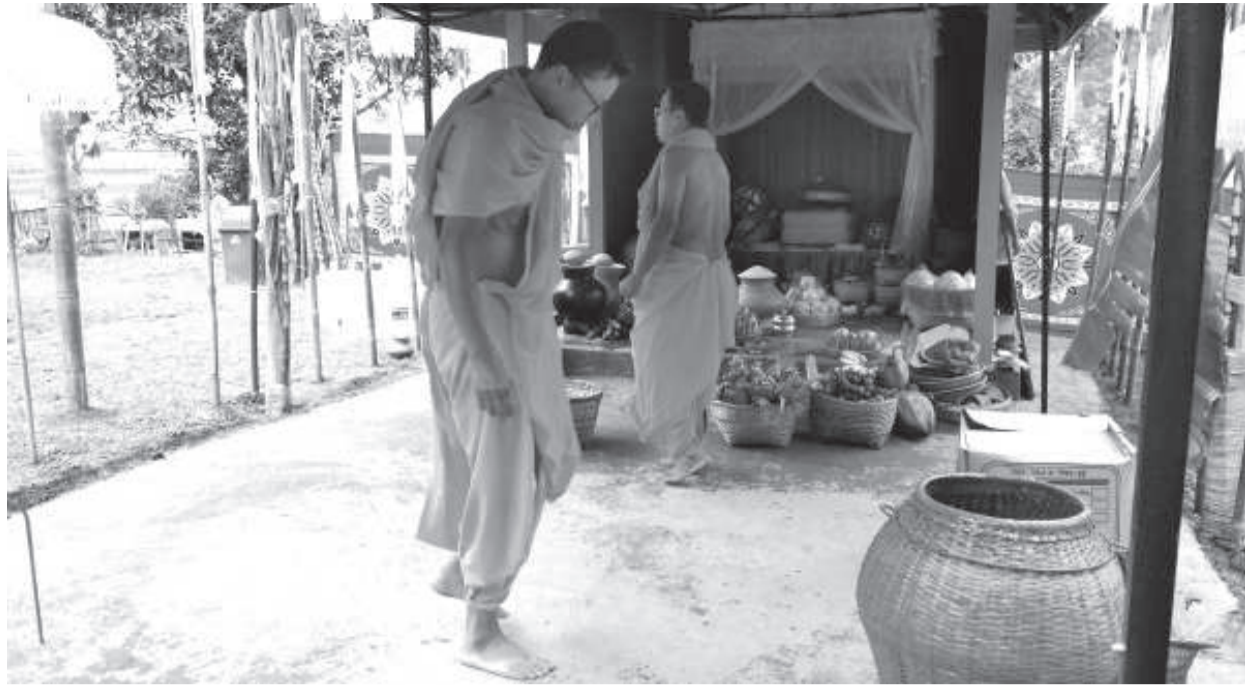
পত্নী শঙ্কলেন লাইপুং হুয়াও ঙ্গাং খৌনীগী মঙনি চনবা নুমিংতা লৈবাক মীয়ামগী ওইবা খৌনি খৌরম সেলোই লাংমাই চিংচা পাঙথোকপগী শঙ্কম

ট্রাফিক/শাগন অনীমক চিকপা নাবা, য়েংকী হকচাং তঙায় অমা চিকপা নাবা, খোঙ খুং শজিং তোয়না হৌরগা ইপং পংশিনবা, শিংলি নাওরি শোনবা, কপ্লাক মরি, খুকউগী মসলশিং চিকপা নাবা, খোঙ হায়া যাদবা, খোঙ হায়া চাং নাইদবা ফহনবগী ওজা জিয়া উল হগপু থাগচরি