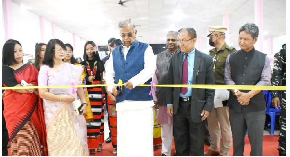
জি পি ব্রিমেন্স কোলেজদা পাঙথোকখিবা বান দে নেনাল কনফারেন্স ওন ট্রাইবেল হেরোস ইন ইন্ডিয়ান ক্রিম মুভমেন্টকী যৌরমদা মণিপুরগী গভর্নর

মহাক্সা মখা তানা ফোঙদোকখিবা, ওসি মীয়ামগী ওইবা রেপ্লি অসিদা শরফ হানবগীদমক মহাক্সা লাকখিবা মতমদা বিজে পিগী তোঙান তোঙানবা পোষ্টরিং থেংনখি। অমদি বিজে পিগী মেনিফেস্টো পাখি। মদু পার্বা মতমদা যান্না নোক্লিংবা অমা ফাওখি। বিজে পিনা স্টেট অসিদা লৈরিবা নহা খুদিংমক থবক পীগনি হায়রি অদুগা নোর্থ ইষ্ট স্টেটশিংদা বিজে পিগী অটোবা লাল্লোং য়াংলিবা অসামগী চীফ মিনিষ্টর হিমন্ত বিশ্ব সর্মনা মিসকোলগী খুশাদা থবক পীগনি হায়রি। অদু হায়রিবা থবকশিং অদু হোজিক কদয়াদা চংখবগে হায়না মহাক্সা মখা তানা হংখি হায়রি।